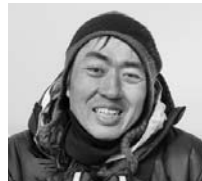
写真家・小原玲氏